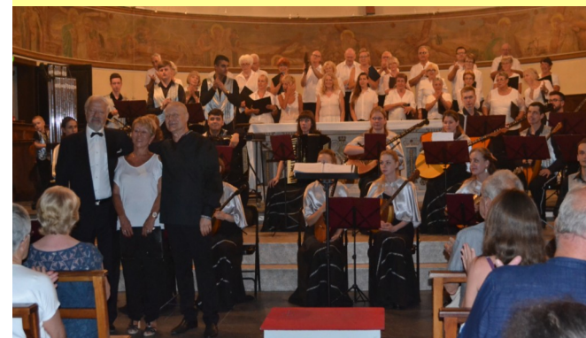
Concert de Bourgeois de Péage le 8 juillet 2017